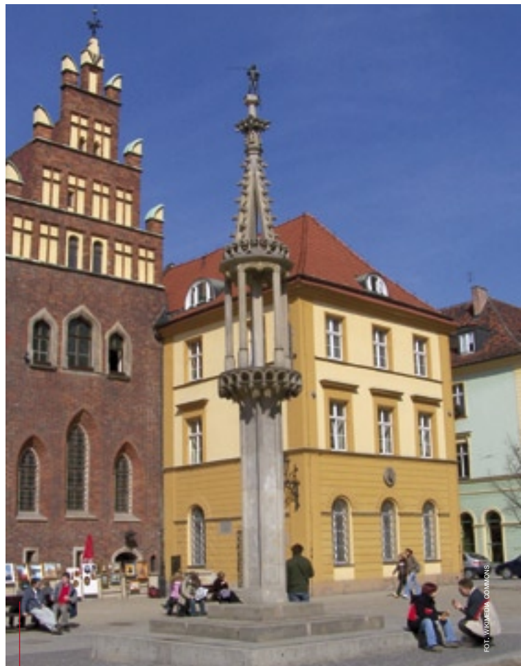
Rekonstrukcja pręgierza wrocławskiego z 1985 r.