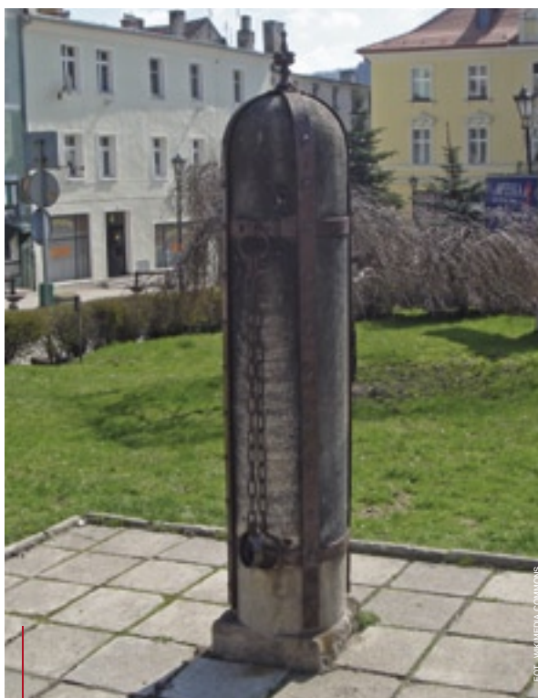
Pręgierz z 1556 r. stanął na Małym Rynku w Bystrzycy Kłodzkiej w 1813 r.