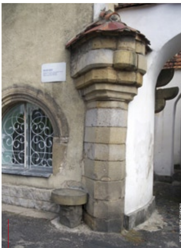
Pręgierz przyścienny z 1533 r. w Lubomierzu