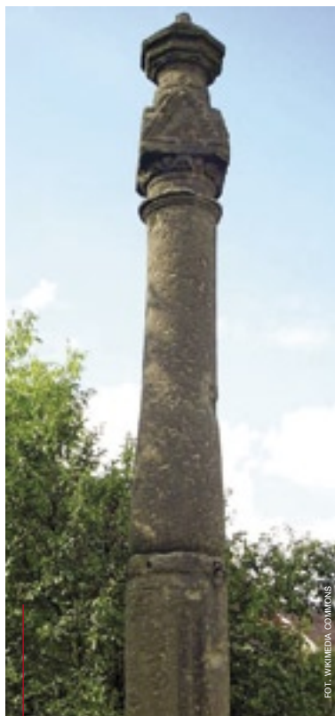
Pręgierz w Rogowie Sobóckim z 1550 r.

postawiono w 1533 roku, czyli dwa lata przed poznańskim. Składa się on z siedmiu zestawionych ze sobą elementów oraz uskokowej głowicy z daszkiem. Wysokość wynosi 3,4 m. Nie przetrwał piaskowcowy pręgierz w Jeleniej Górze, rozebrany w 1739 r. Na trójstopniowym podeście stała kolumna z ażurową klatką, a w niej rzeźba kata. W pobliżu miasta, w nieodległym Miłkowie koło Karpacza zachowała się jednak pręgierzopodobna kolumna, a w znanym z jednego z największych w Polsce opactw cysterskich Krzeszowie koło Kamiennej Góry (ok. 30 km na wschód od Jeleniej Góry) stoi kamienny pręgierz wysokości 3,6 m.