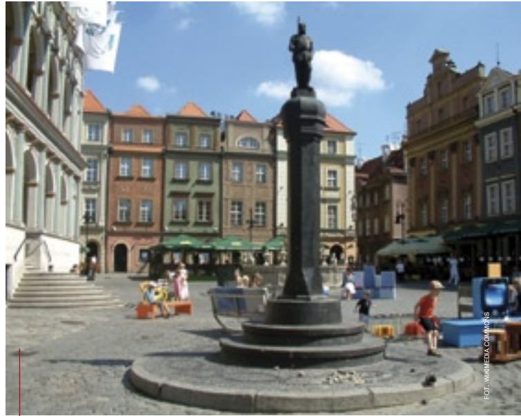
Poznań. Wykonana w 1925 r. kopia średniowiecznego pręgierza znajdującego się obecnie w podziemiach Ratusza

Jeszcze w tym samym roku 1535 w Poznaniu stanął kamienny pręgierz. Składał się z dwupółmetrowego trzonu o przekroju ośmiobocznym. Wmontowano trzy żelazne obręcze do przeciągania sznurów oraz dwa łańcuchy zakończone kunami na szyje skazańców. Górą część wieńczył posązek mężczyzny odzianego w renesansową zbroję i kolczugę. Na dolnym fragmencie profilowanej głowicy kolumny wykuto dwa cytaty pochodzące z szóstej księgi Eneidy Wergiliusza. Oba warte są przytoczenia: Vendidi his auro patriam („Ten sprzedał ojczyznę na złoto”) i Discite iustitiam monti et non tenere divos („Upomni, uczcie się sprawiedliwości i nie lekceważcie bo-