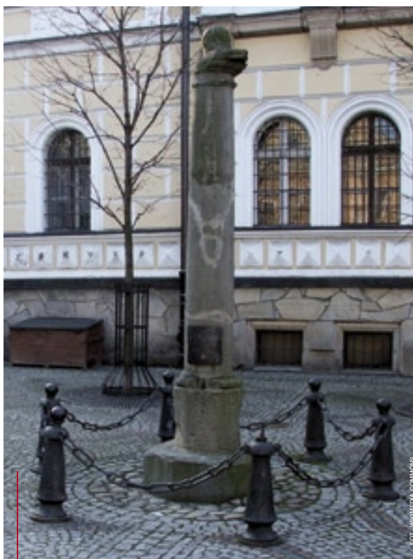
Pochodzący z 1666 r. pręgierz w Łądku Zdroju

wiele brakowało, by jeszcze w XVIII wieku go rozebrano. W 1848 roku usunięto żelazne obręcze i łańcuchy, lecz reszta została. Do roku 1945 pręgierz był jedną z atrakcji turystycznych, oglądaną i podziwianą. Po zdobyciu „Festung Breslau” przez wojska radzieckie nastąpiło najgorsze. Ocalały z pożogi wojennej piękny pręgierz stał, dopóki nie przejechał po nim skutecznie sowiecki czołg (już po zdobyciu miasta!). Połamane i zdekompletowa-